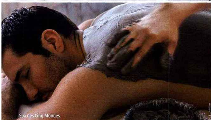
Spa des Cinq Mondes