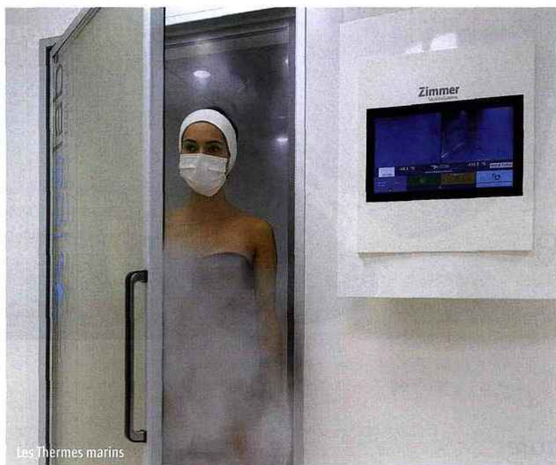
Les Thermes marins

BIEN-ETRE/ Pour l'été, les spas de la principauté vous proposent des formules rafraîchissantes ou coo-ning.